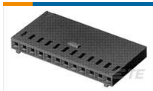
TE 产品编号280359 AMPMODU II REC. HSG, SINGLE ROW, 4 POS.