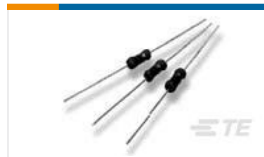
TE 产品编号2-1625892-5 3W SM M/OX 5% 1M0