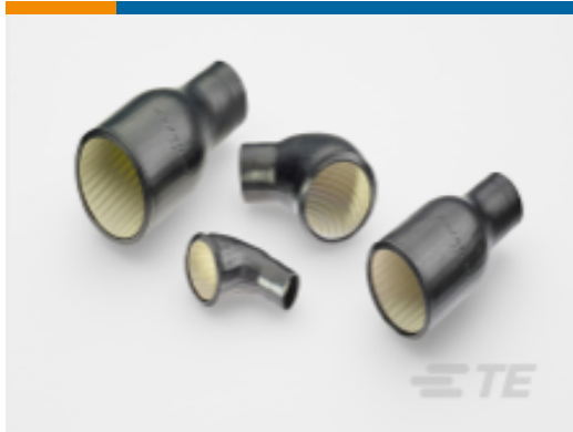
TE 产品编号EK7273-000 202S132-25C-0