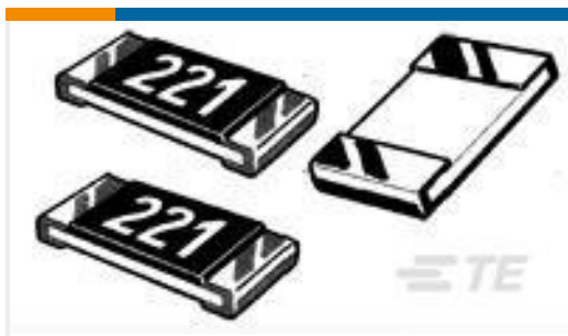
TE 产品编号4-1622820-8 3520 470R 5%