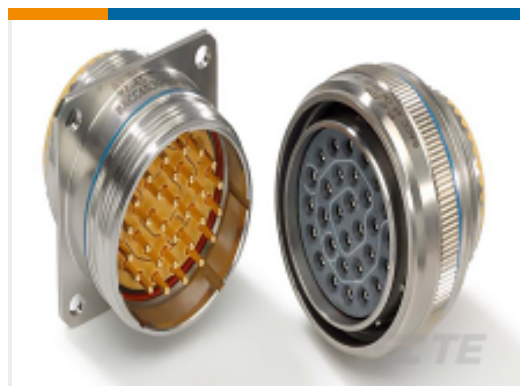
TE 产品编号ZPF0000000000007174 983-ORS 08-98 PN