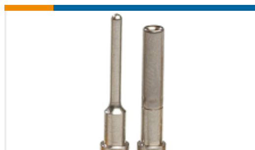
TE 产品编号 ZPF0000000000001261 097-0267-16 A1267