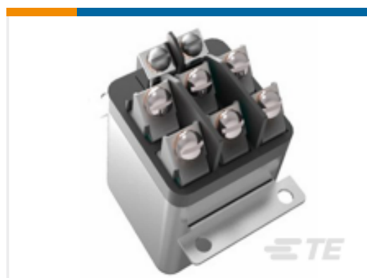
TE 产品编号1617807-5 FC-335-SY8= RELAY, 3PST