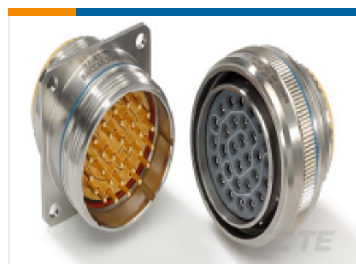
TE 产品编号ZPF00000000000007174 983-ORS 08-98 PN