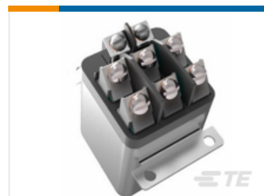
TE 产品编号1617807-5 FC-335-SY8= RELAY, 3PST