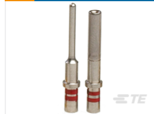
TE 产品编号ZPF0000000000001261 097-0267-16 A1267