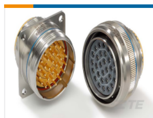
TE 产品编号ZPF0000000000007174 983-ORS 08-98 PN