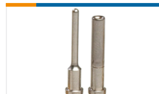
TE 产品编号ZPF000000000001261 097-0267-16 A1267