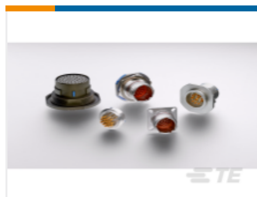
TE 产品编号YDTS20Y13-98XNV001 HERM RECP