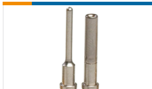
TE 产品编号ZPF0000000000001261 097-0267-16 A1267