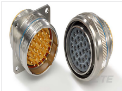
TE 产品编号ZPF0000000000033605 983-0SE 10-06 P8