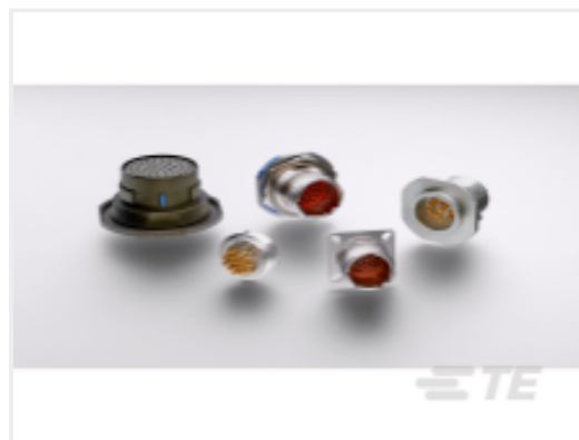
TE 产品编号YDTS20N11-35PNV001 HERM RECP