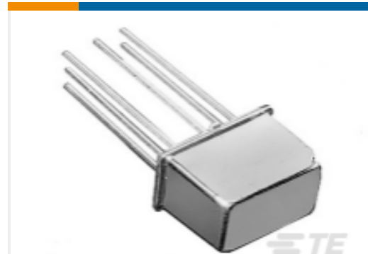
TE 产品编号1617147-5 JMGAP-26P = M39016/17-030P