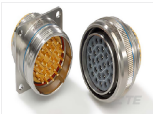
TE 产品编号 ZPF0000000000007174 983-ORS 08-98 PN