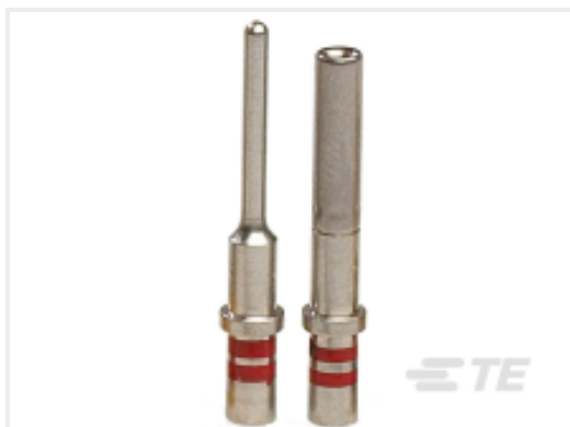
TE 产品编号 ZPF000000000001261 097-0267-16 A1267