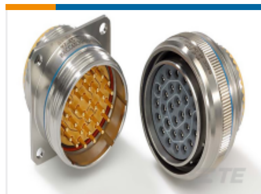
TE 产品编号ZPF0000000000007174 983-ORS 08-98 PN