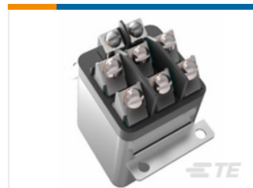
TE 产品编号1617807-5 FC-335-SY8= RELAY, 3PST