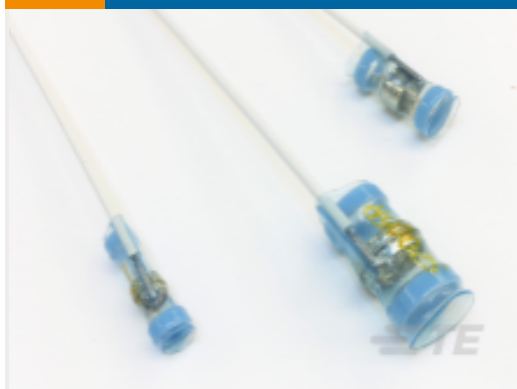
TE 产品编号EH1934-000 S200-1-55-22-9