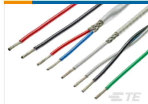
TE 产品编号3690533001 99M0111-28-0