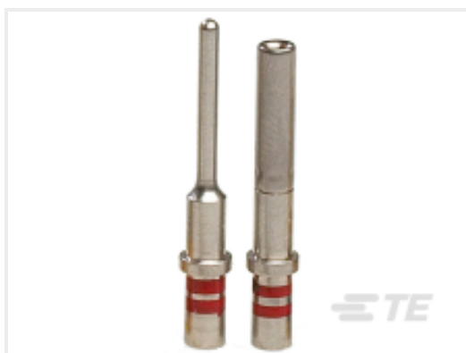
TE 产品编号ZPF00000000001261 097-0267-16 A1267