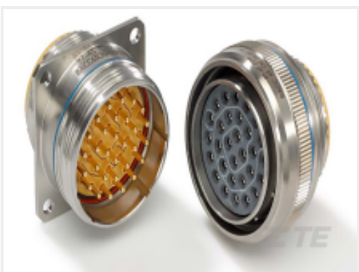
TE 产品编号ZPF000000000007174 983-ORS 08-98 PN