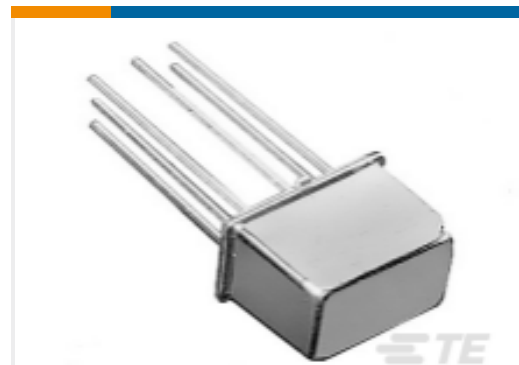
TE 产品编号1617147-5 JMGAP-26P = M39016/17-030P