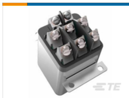
TE 产品编号1617807-5 FC-335-SY8= RELAY, 3PST