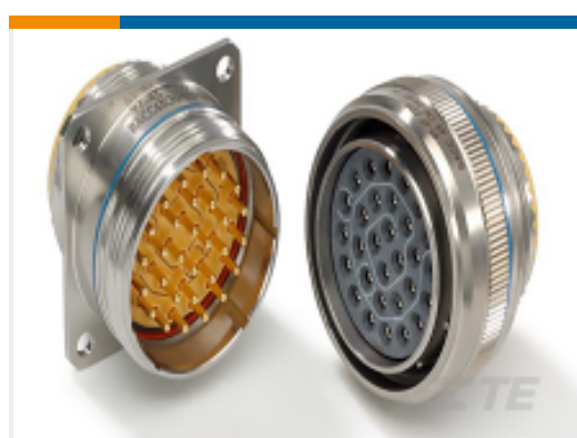
TE 产品编号ZPF0000000000007174 983-ORS 08-98 PN