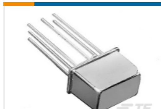
TE 产品编号1617147-5 JMGAP-26P = M39016/17-030P