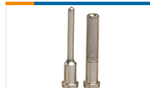
TE 产品编号ZPF0000000000001261 097-0267-16 A1267