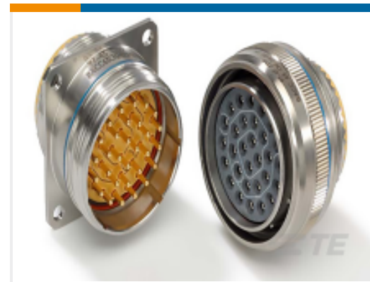
TE 产品编号ZPF0000000000007174 983-0RS 08-98 PN