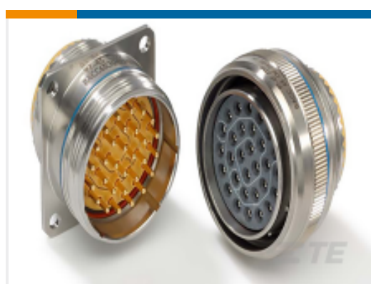
TE 产品编号ZPF0000000000007174 983-0RS 08-98 PN