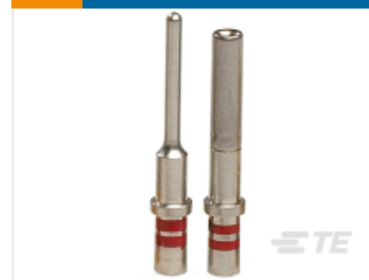
TE 产品编号ZPF000000000001261 097-0267-16 A1267