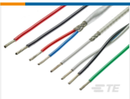
TE 产品编号3827653001 44A1121-18-0/9-0