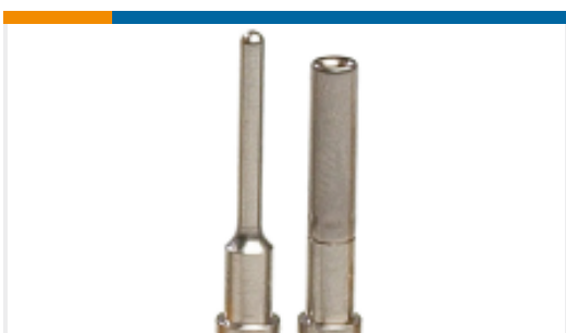
TE 产品编号 ZPF0000000000001261 097-0267-16 A1267