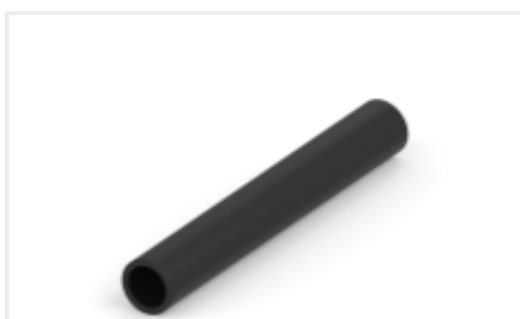
TE 产品编号CAT-HST-BSTS BSTS/BSTS-FR 热缩管