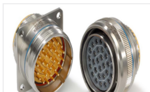
TE 产品编号ZPF000000000007174 983-ORS 08-98 PN