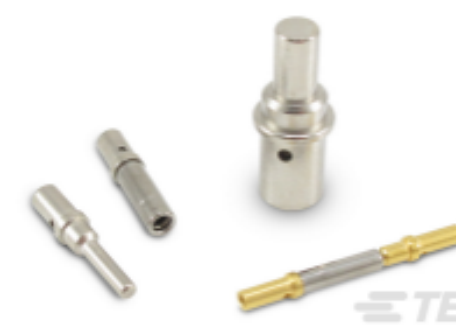
TE 产品编号0460-202-16141 DEUTSCH Solid Contacts