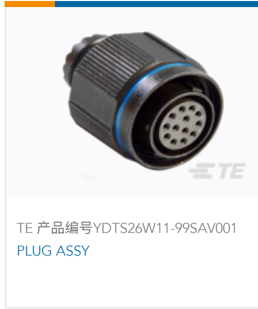
TE 产品编号YDTS26W11-99SAV001 PLUG ASSY