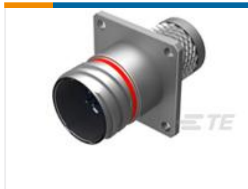
TE 产品编号2102343-1 Ceelok FAS-T, Recept Kit, Sq, Ni