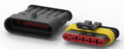
TE 产品编号282104-1 AMP SUPERSEAL 1.5MM，连接器壳体