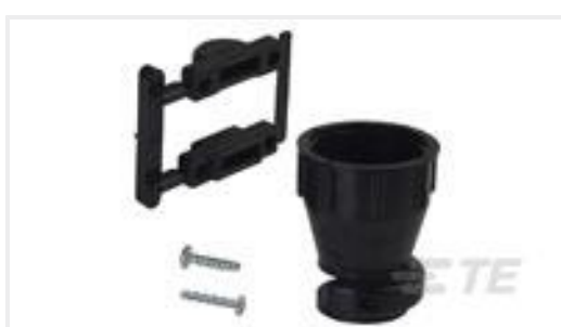
TE 产品编号206070-8 CABLE CLAMP KIT #17