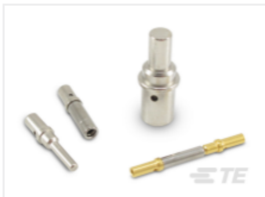
TE 产品编号CAT-D48-ST273 DEUTSCH Solid Contacts