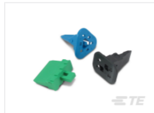
TE 产品编号CAT-D487-W416 Wedgelocks: DEUTSCH DT