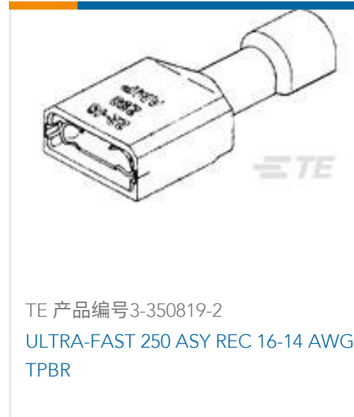
TE 产品编号3-350819-2 ULTRA-FAST 250 ASY REC 16-14 AWG TPBR