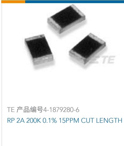
TE 产品编号4-1879280-6 RP 2A 200K 0.1% 15PPM CUT LENGTH