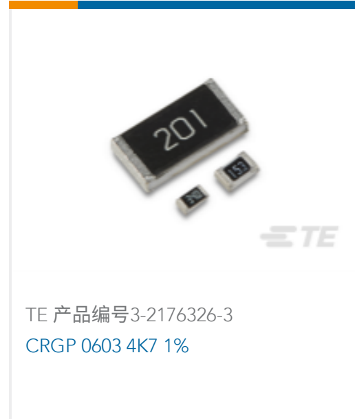
TE 产品编号3-2176326-3 CRGP 0603 4K7 1%