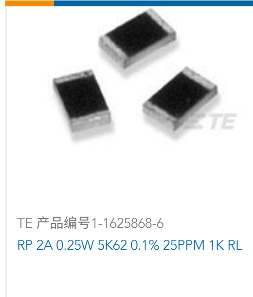
TE 产品编号1-1625868-6 RP 2A 0.25W 5K62 0.1% 25PPM 1K RL