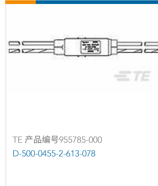
TE 产品编号955785-000 D-500-0455-2-613-078