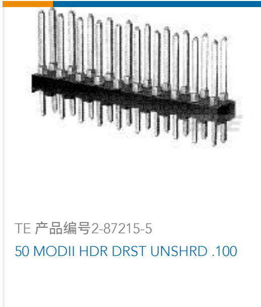
TE 产品编号2-87215-5 50 MODII HDR DRST UNSHRD .100