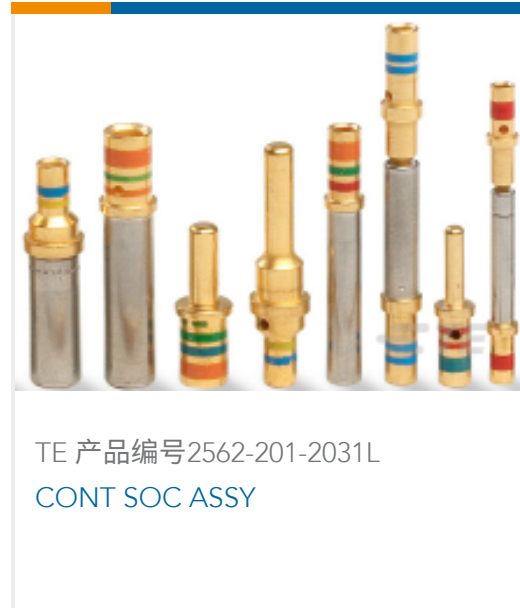
TE 产品编号2562-201-2031L CONT SOC ASSY