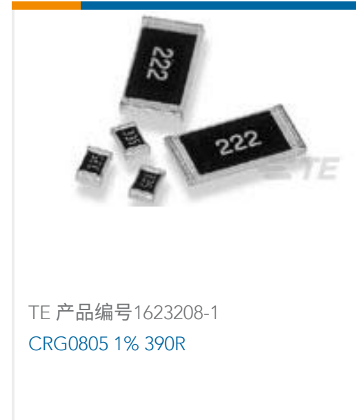
TE 产品编号1623208-1 CRG0805 1% 390R