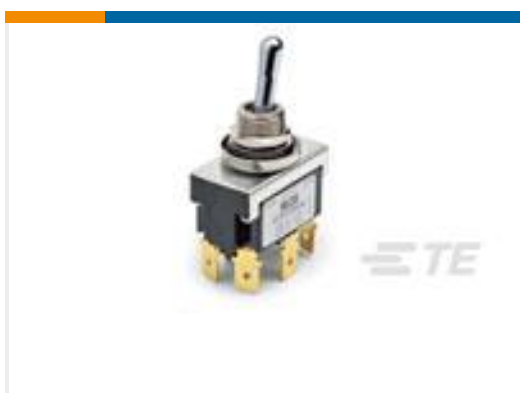
TE 产品编号 7-6437630-2 AWTN1504 = POWER TOGGLE