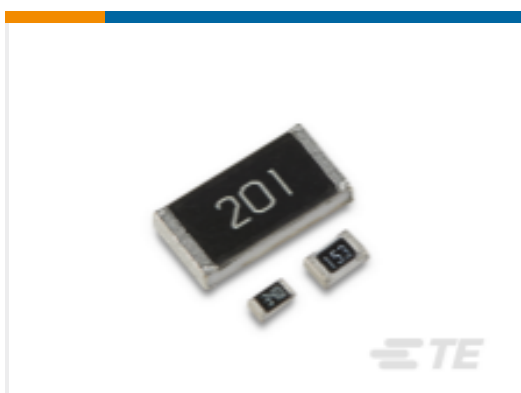
TE 产品编号 2-2176326-9 CRGP 0603 2K2 1%