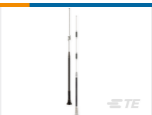
TE 产品编号 EB8965C WHIP,EF,CT,896-970MHz 933MHz,5, BK,GP,