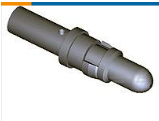
TE 产品编号 212007-1 CONTACT PIN ASSY, SZ 8