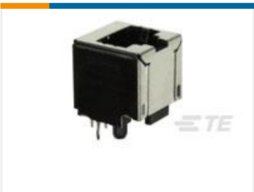
TE 产品编号 6116202-1 MJ,TE,8P,COMPL.PIN,CAT5,PC