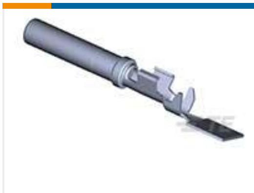
TE 产品编号 1062-16-0677 SOC, SF, SIZE 16, 16-20, SN/SN