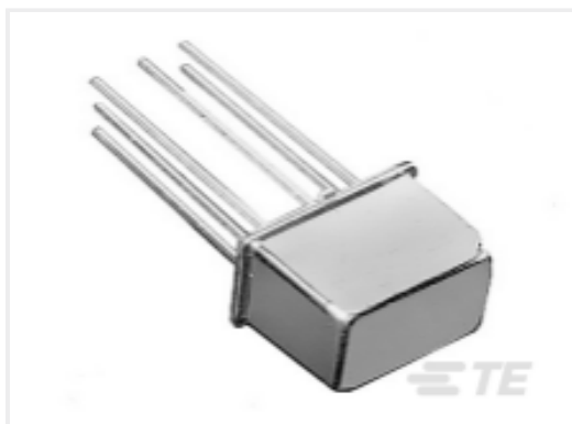
TE 产品编号 1617147-5 JMGAP-26P = M39016/17-030P