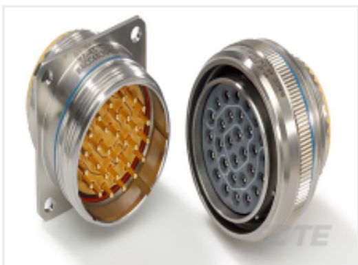
TE 产品编号 ZPF00000000007174 983-0RS 08-98 PN