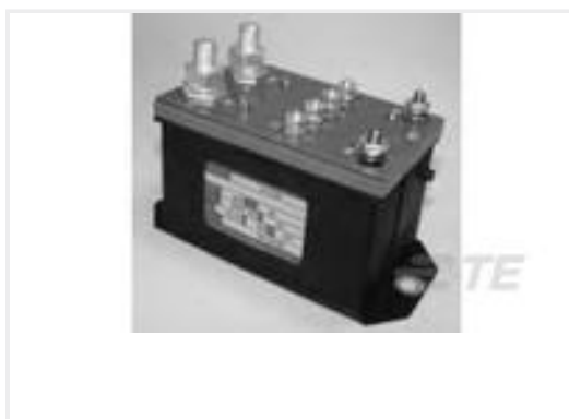
TE 产品编号 1616058-6 A703CD (FAA/PMA)=RELAY