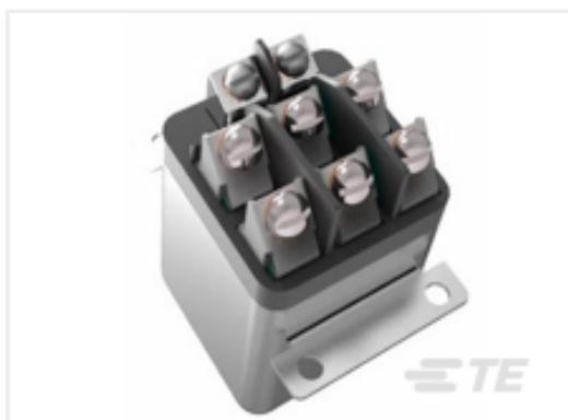
TE 产品编号 1617807-5 FC-335-SY8= RELAY, 3PST