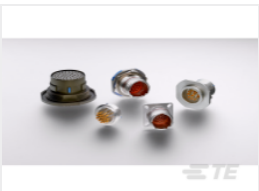
TE 产品编号 YDTS20Y13-98XNV001 HERM RECP