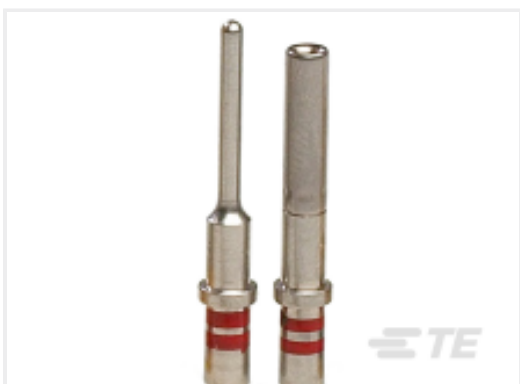
TE 产品编号 ZPF00000000001261 097-0267-16 A1267