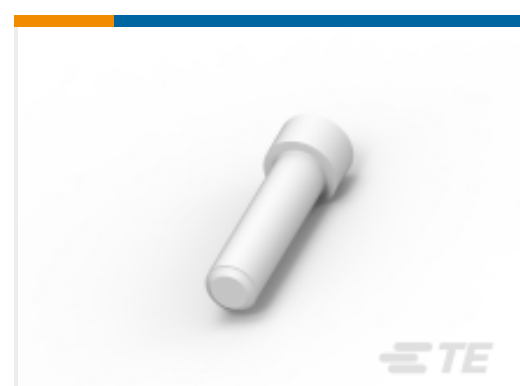
TE 产品编号114017-ZZ SEALING PLUG, SIZE 12/16, WHT