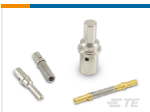
TE 产品编号0460-202-16141 DEUTSCH Solid Contacts