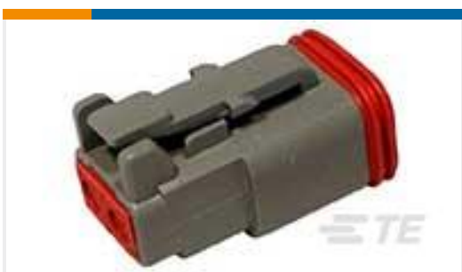
TE 产品编号DT06-2S PLG, 2P, GRY, N