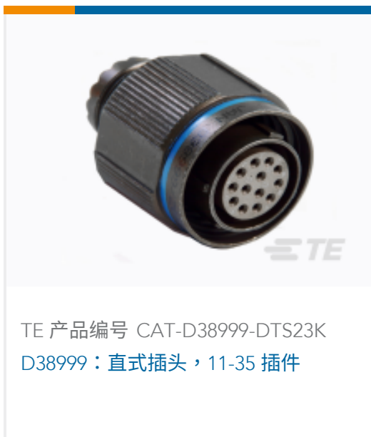
TE 产品编号 CAT-D38999-DTS23K D38999：直式插头，11-35 插件