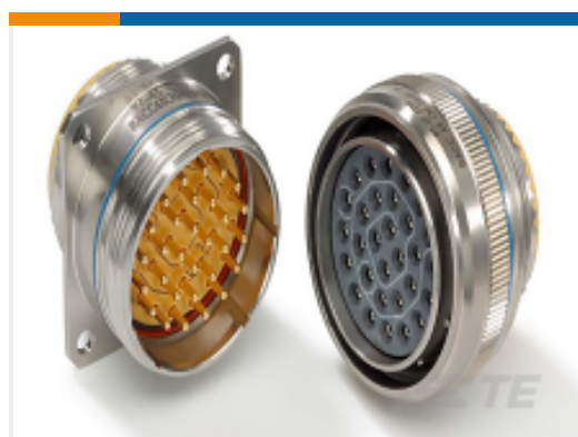
TE 产品编号ZPF000000000007174 983-0RS 08-98 PN