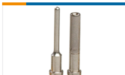
TE 产品编号ZPF00000000001261 097-0267-16 A1267