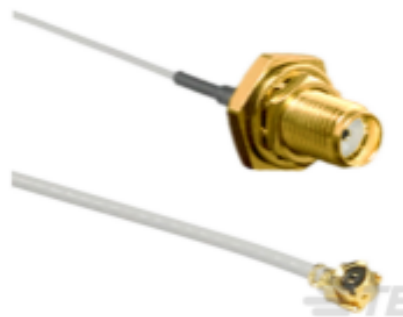
TE 产品编号CSI-SGFI-100-UFFR SMA to U.FL/MHF1 100mm 1.13 OD