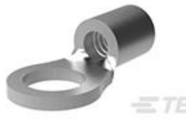
TE 产品编号35476 TERMINAL, SOLIS R 12-10 6