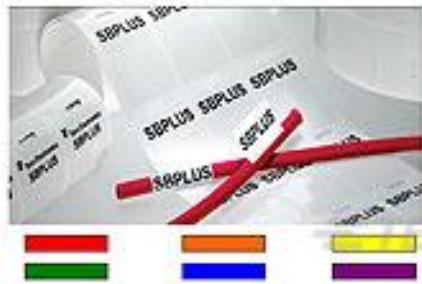
TE 产品编号CN9936-000 SBP200375WE2.5