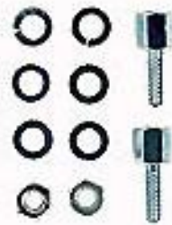
TE 产品编号5205817-2 FEMALE SCREWLOCK KIT, BULK PKG