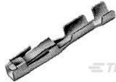
TE 产品编号5531216-2 T/SPRING LP