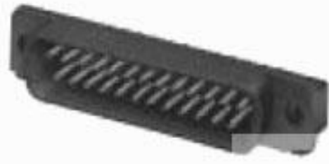
TE 产品编号5208006-2 HD-20 PLUG 9P VERT