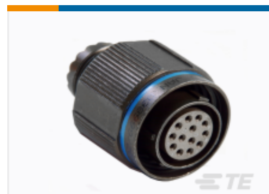
TE 产品编号YDTS26W09-35SAV001 PLUG ASSY