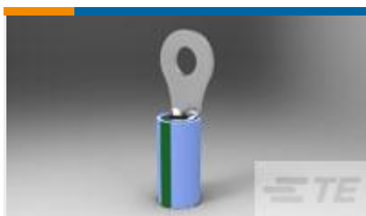
TE 产品编号2-320561-4 TERMINAL,PIDG R IR 14 6