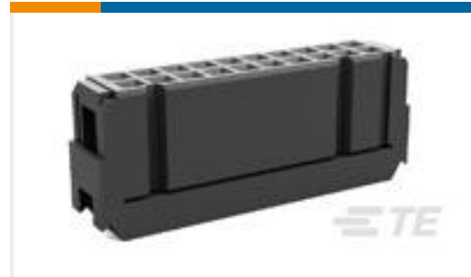
TE 产品编号1-1658620-2 064 NOVO MIL 15DP FT