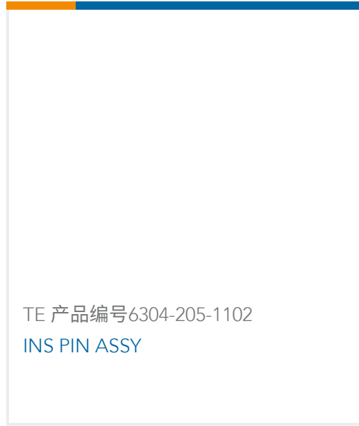
TE 产品编号6304-205-1102 INS PIN ASSY