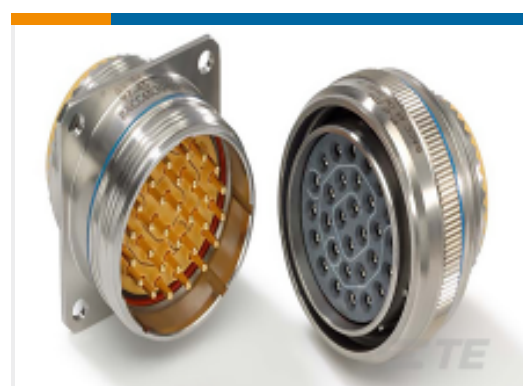
TE 产品编号ZPF0000000000007174 983-ORS 08-98 PN