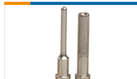
TE 产品编号ZPF000000000001261 097-0267-16 A1267