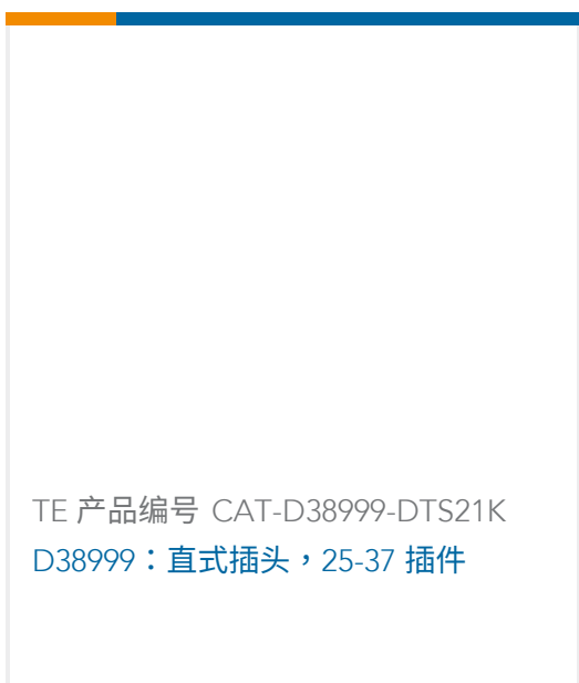
TE 产品编号 CAT-D38999-DTS21K D38999：直式插头，25-37 插件