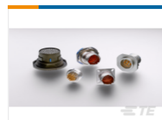
TE 产品编号YDTS20Y13-98XNV001 HERM RECP