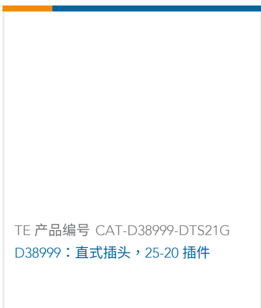
TE 产品编号 CAT-D38999-DTS21G D38999：直式插头，25-20 插件