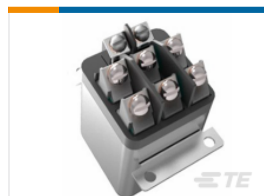
TE 产品编号1617807-5 FC-335-SY8= RELAY, 3PST