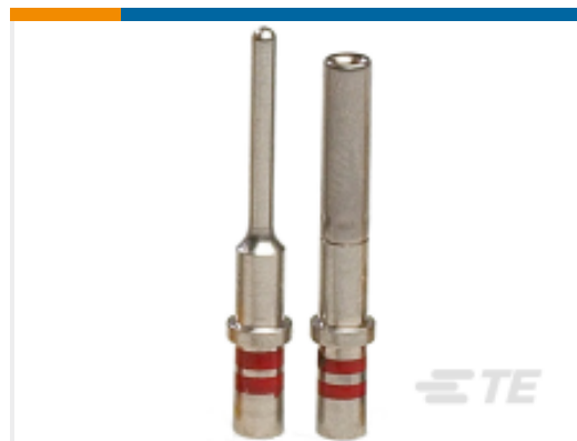
TE 产品编号ZPF00000000001261 097-0267-16 A1267