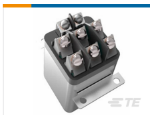
TE 产品编号1617807-5 FC-335-SY8= RELAY, 3PST