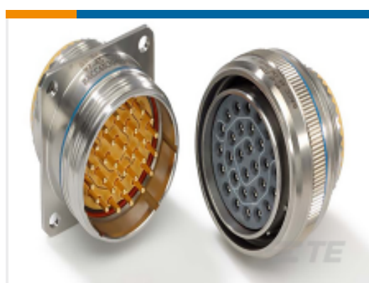
TE 产品编号ZPF0000000000007174 983-ORS 08-98 PN