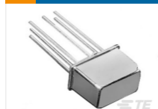
TE 产品编号1617147-5 JMGAP-26P = M39016/17-030P