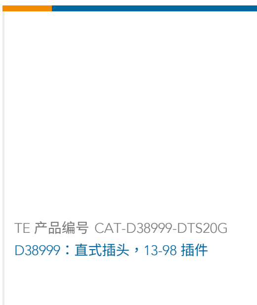
TE 产品编号 CAT-D38999-DTS20G D38999：直式插头，13-98 插件