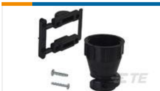
TE 产品编号206070-8 CABLE CLAMP KIT #17