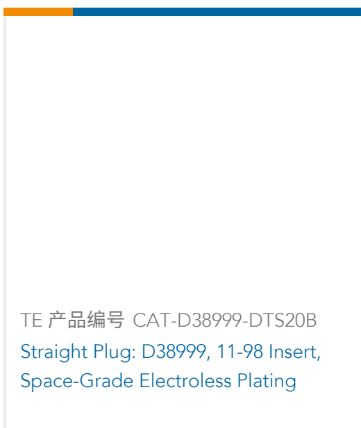
TE 产品编号 CAT-D38999-DTS20B Straight Plug: D38999, 11-98 Insert, Space-Grade Electroless Plating