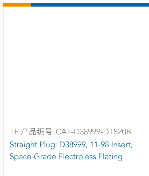
TE 产品编号 CAT-D38999-DTS20B Straight Plug: D38999, 11-98 Insert, Space-Grade Electroless Plating