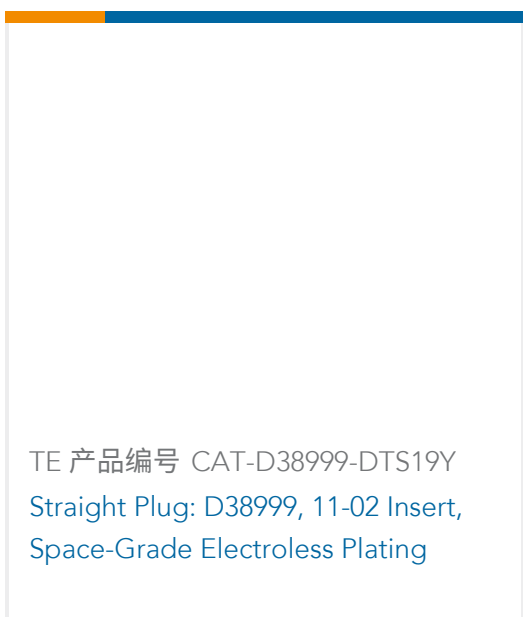
TE 产品编号 CAT-D38999-DTS19Y Straight Plug: D38999, 11-02 Insert, Space-Grade Electroless Plating